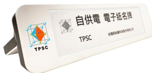
室內電子桌牌應用